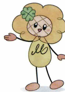
緑中 CS キャラクター 「みどりん」