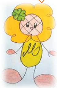
緑中 CS キャラクターみどりん